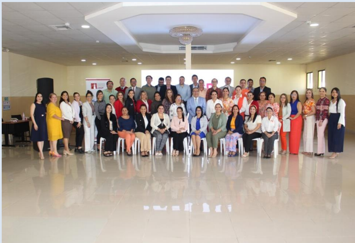
Ilustración 1. Primer taller, construcción participativa PEDI, junio 2024